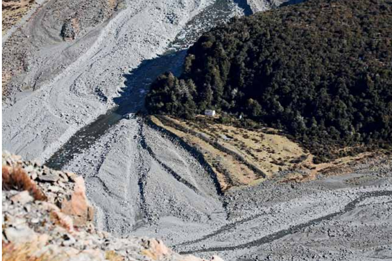
Højt ned. Jægernes hytte ligger som en lille hvid plet næsten lodret neden for bjerget.

► om man konstant havde den lille, irriterende Gollum hængende lige i røven.