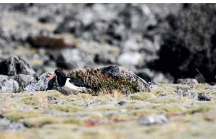
Dyrelivet er rigt og farvestrålende, her en New Zealandsk strandskade ved Clyde River.