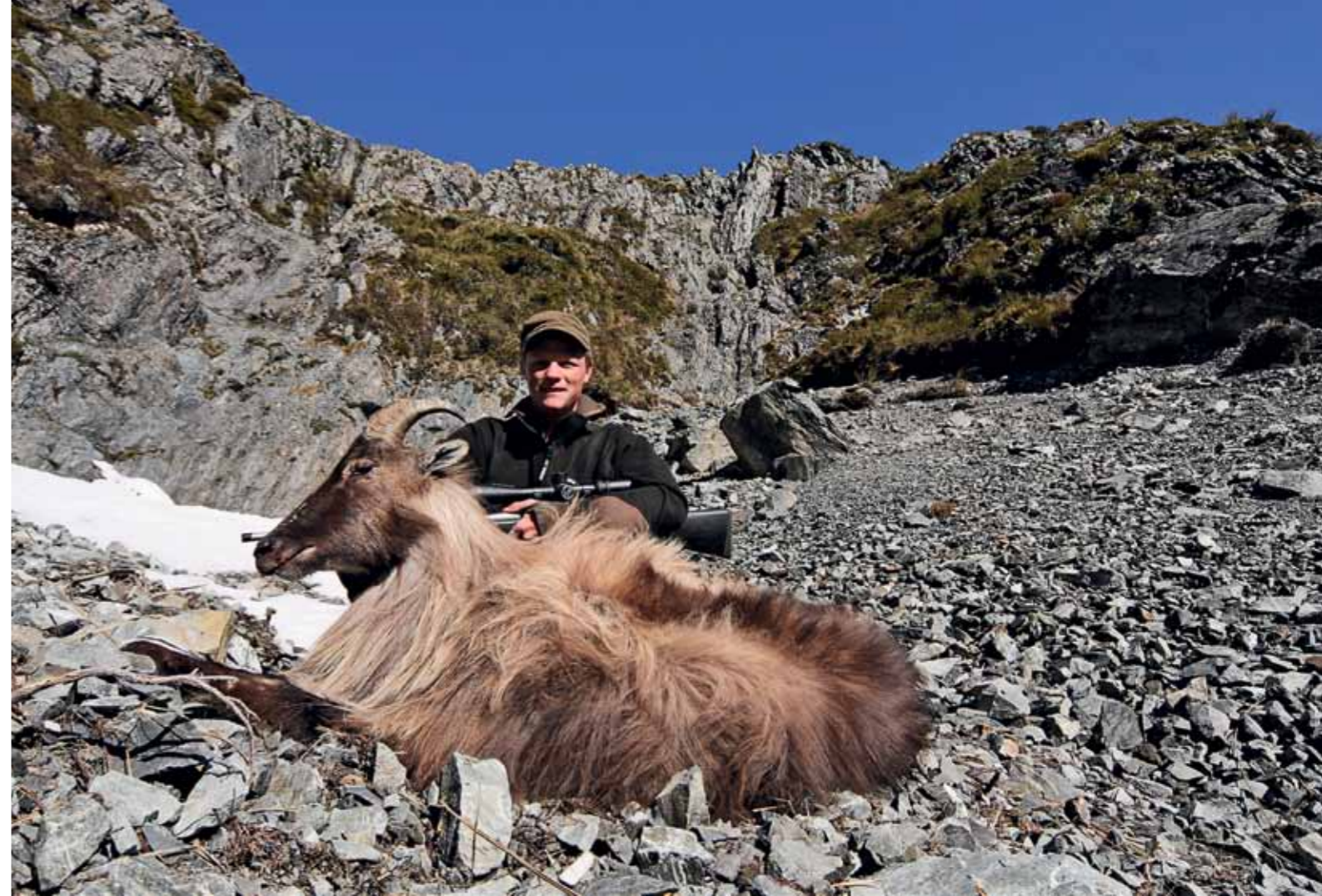
Forfatteren med den flotte bull-tahr, han skød i starten af den første jagtdag.