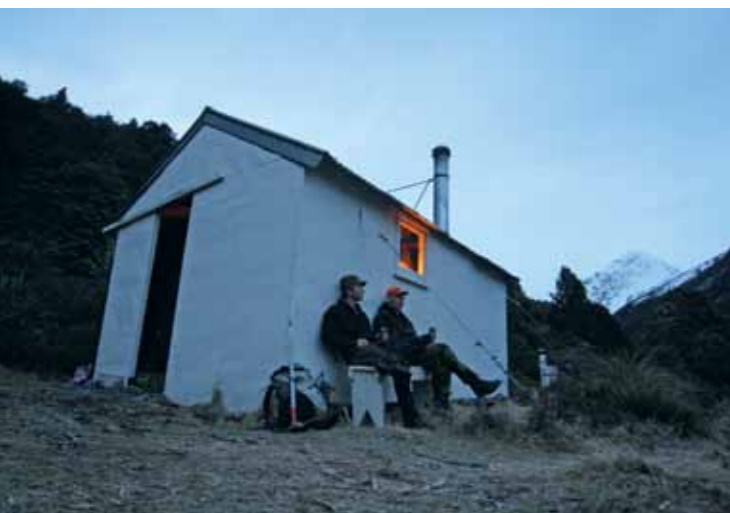
Efter en hård dag på bjergsiderne kommer to kolde Speight på bordet.