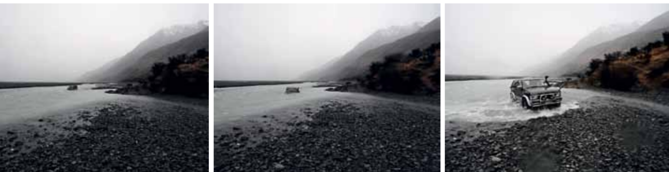
Den første vilde rivercrossing.