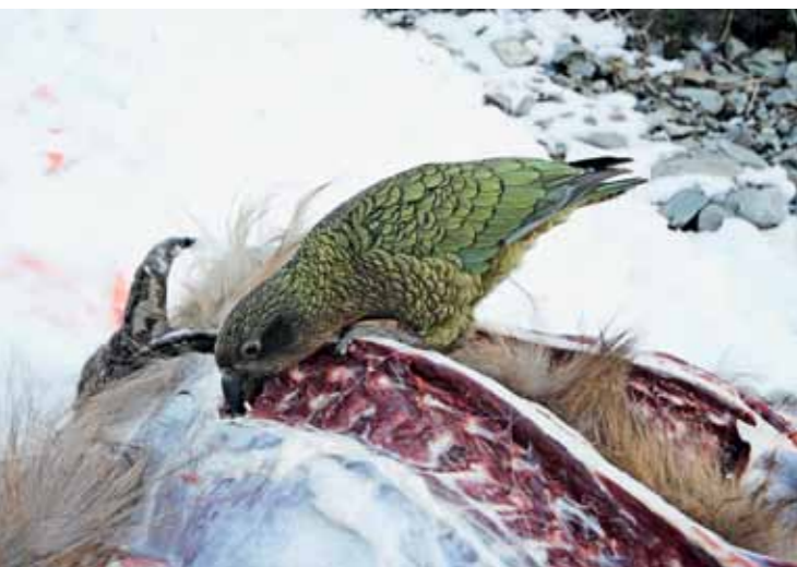
En sulten Kea-papegøje smæsker sig i resterne af en nedlagt tahr.

► hvordan den tumlede ned af sneen, ramte et klippeudhæng og faldt omtrent 70 yards i frit fald, før den stoppede i sneen meget længere nede ad bjerget. Det var vildt det her, og mit adrenalin var på kogepunktet.