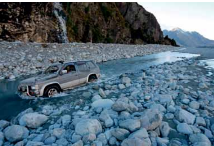
Flod-kørslen ved Black Bluff var vildt krævende, men det skulle blive meget værre.